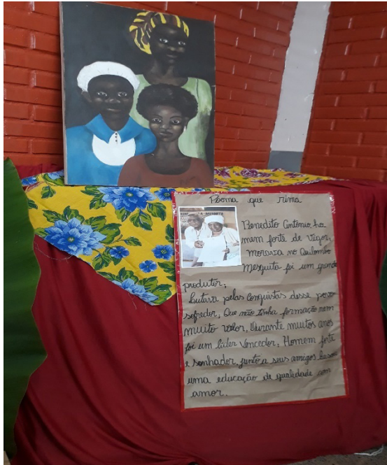
Quadro 4: produtos escritos e multimodais do chá literário.